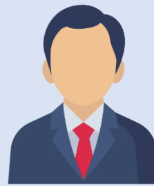
អគ្គនាយកក្រុមហ៊ុន