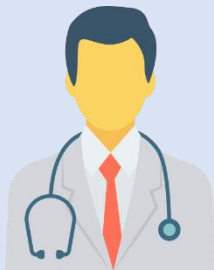
គ្រូពេទ្យ